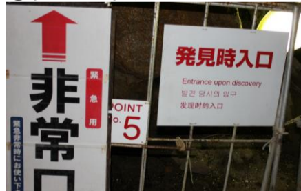
⑤探検コース分岐点